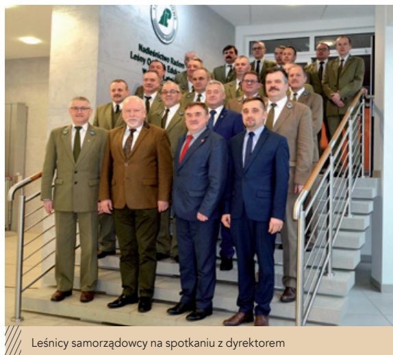
Leśnicy samorządowcy na spotkaniu z dyrektorem