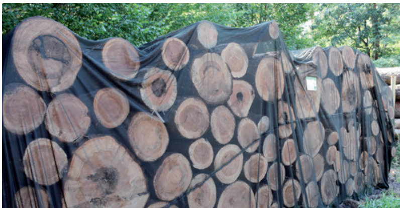
Zabezpieczenie drewna sprzed kornikiem z użyciem siatki