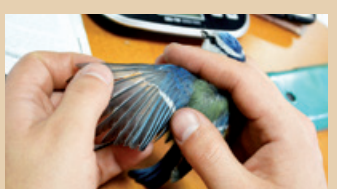
Podczas akcji Karmnik odłowiono głównie sikory