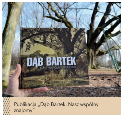
Publikacja „Dąb Bartek. Nasz wspólny znajomy”