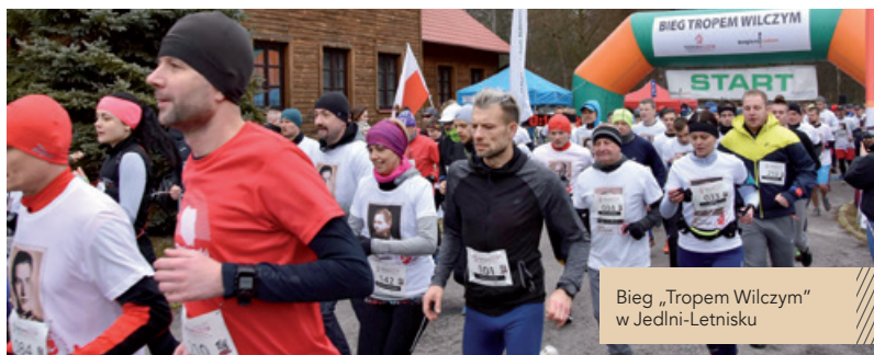
Bieg „Tropem Wilczym” w Jedlni-Letnisku