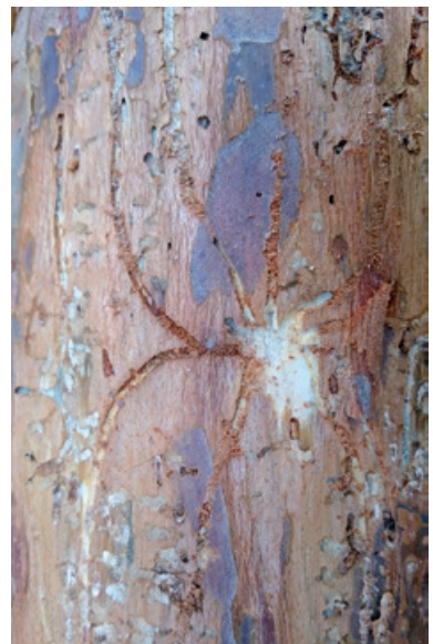
Żerowisko kornika ostrozębnego

na zima, niedobór opadów i wysokie temperatury w okresie wegetacyjnym. Warunki te doprowadziły do dodatkowego namnażania się kornika ostrozębnego przez wyprowadzenie zwiększonej liczby rójek w stosunku do utartych informacji entomologicznych (w tym generacje „siostrzane”). Powyższe dane wskazują na to, że kornik ostrozębny to już w zasadzie problem ogólnopolski, który stanowi podobne zagrożenie dla drzewostanów sosnowych, jakie dla drzewostanów świerkowych powoduje kornik drukarz.