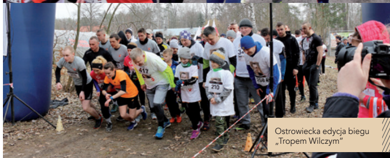
Ostrowiecka edycja biegu „Tropem Wilczym”