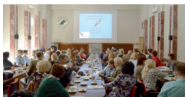
Konferencja dotyczyła projektów realizowanych wspólnie z leśnikami

28 lutego w siedzibie RDLP w Radomiu odbyła się kolejna wspólna z LOP i SITLiD konferencja. Tym razem pod hasłem „Las – świat roślin i zwierząt”. Rozmawiano o projektach realizowanych wspólnie z leśnikami – ochronie bociana czarnego oraz nietoperzy. Wręczono też nagrody w konkursie „Mój las”.